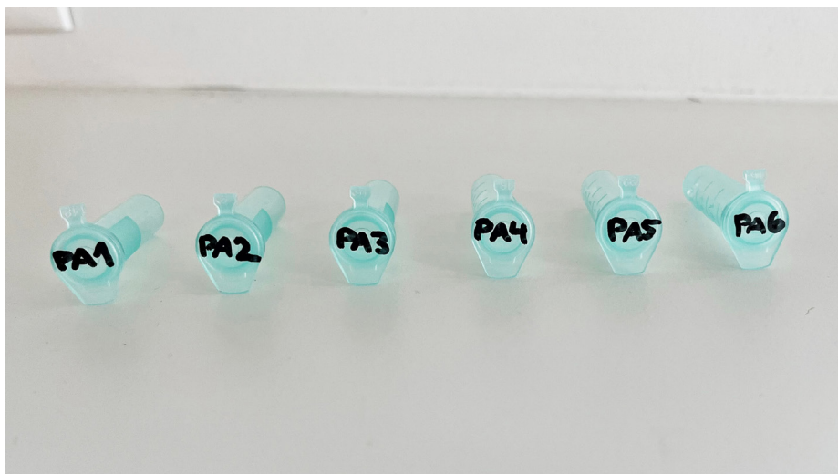
Sådan skal de grønne rør mærkes. Trinnet gentages, så der mærkes i alt 10 grønne rør.