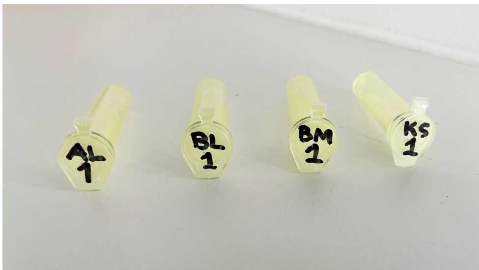
Sådan skal de gule rør mærkes til gruppe 1.