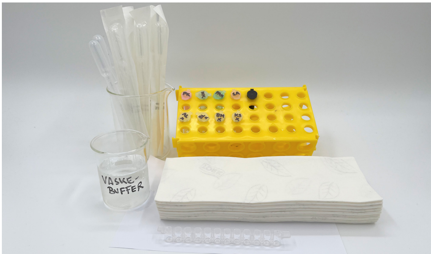
Arbejdsstation for en enkelt gruppe

For at spare tid i undervisningen anbefales det, at du stiller materialerne frem, så de på forhånd er opdelt i arbejdsstationer.